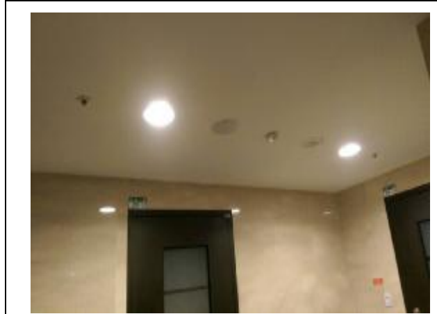
各戶門外設自動感應照明

(七) 各戶廚房地板排水改採封閉式設計，住戶使用時才自行開啟，因此不會有臭氣四溢或蚊蟲問題。