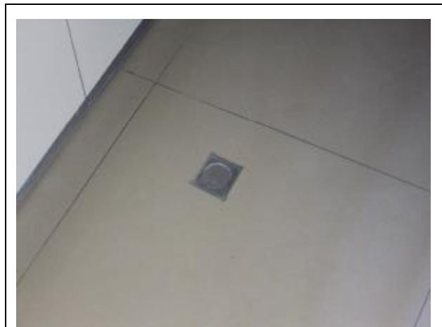
廚房地板封閉式排水口(防臭氣及蚊蟲)

(七) 各戶廚房地板排水改採封閉式設計，住戶使用時才自行開啟，因此不會有臭氣四溢或蚊蟲問題。