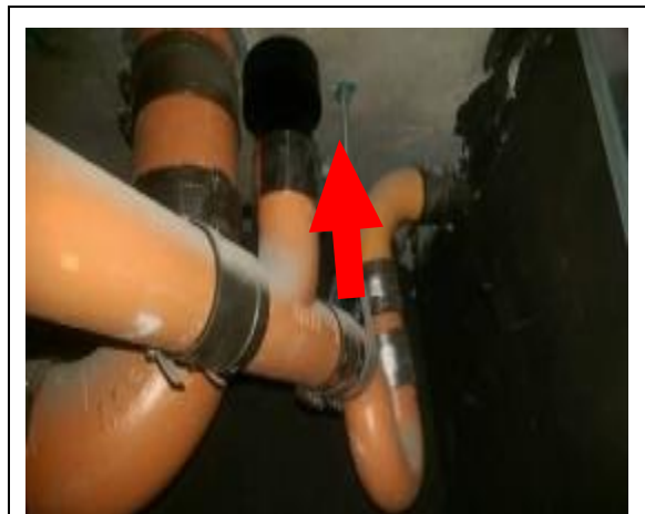
各戶浴室及廚房排水管排氣閥

(八) 一般住戶生活排水除排水管外尚有排氣管，本案採排氣閥設計，因此除可減少使用空氣管之空間外維修時亦相對方便(僅需處理天花板上方之排氣閥)。