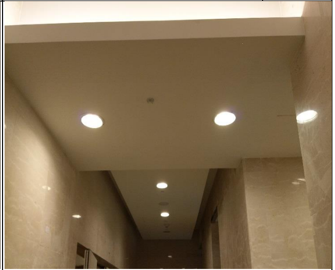
臺億公司辦理 A6 區裝修復原施工督導 | 1060914