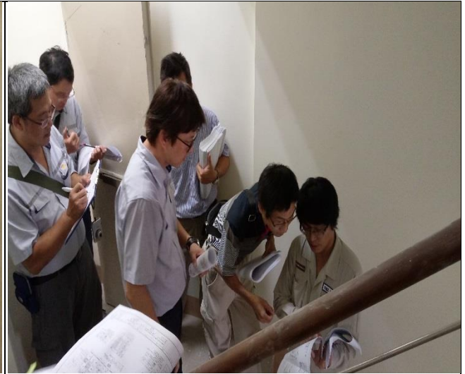
新北市政府工務局辦理 A2 區申請變更 使照併室內裝修現場會勘 1060907