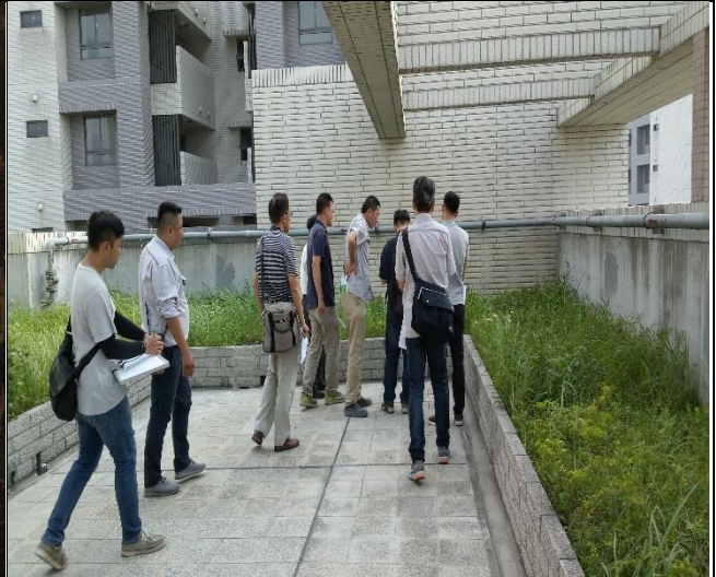
新北市政府工務局辦理 A6 東區申請 使用執照現場會勘