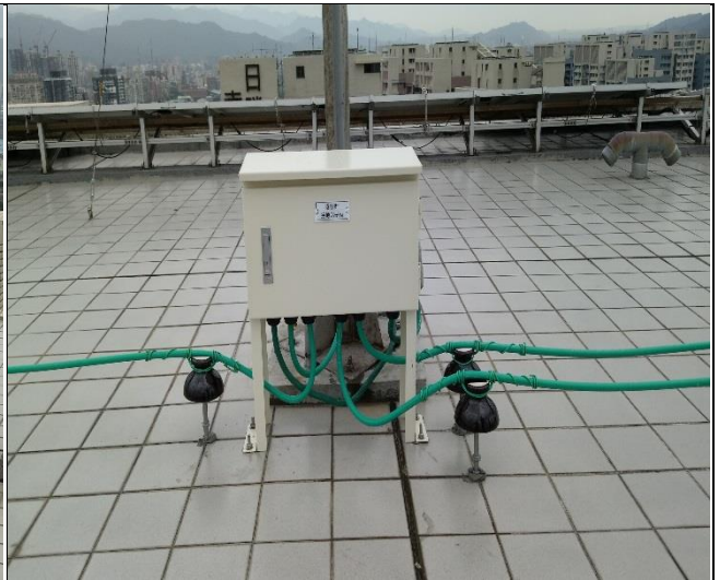
臺億公司辦理防側雷擊避雷系統勘查 1060901