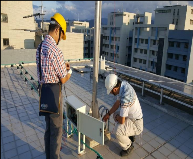
防側雷擊裝置完成第三方技師測試 1060913