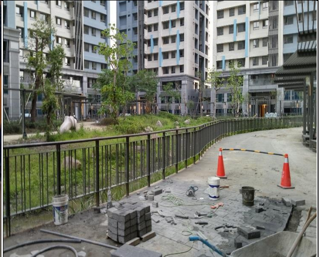
營建署辦理 A6 區裝修復原工程督導 1060907