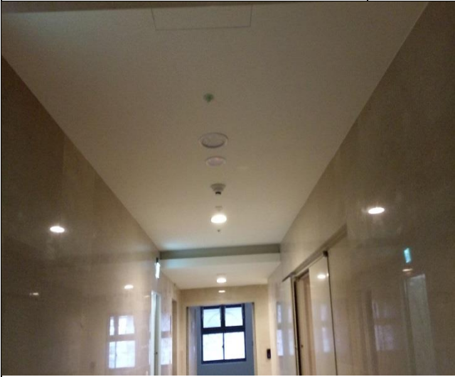
臺億公司辦理 A6 區裝修復原施工督導 | 1060914