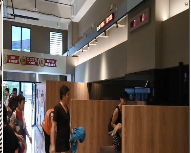
臺億公司辦理交屋驗屋督導