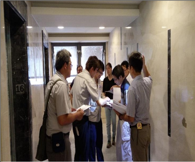
新北市政府工務局辦理 A2 區申請變更 使照併室內裝修現場會勘 1060907