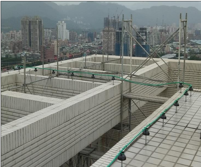
臺億公司辦理防側雷擊避雷系統勘查 1060901