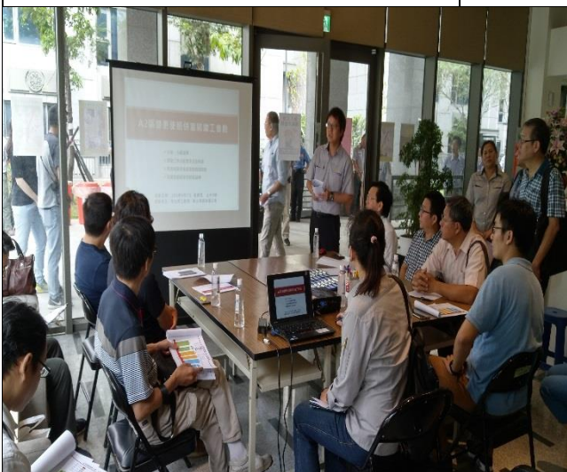
新北市政府工務局辦理 A2 區申請變更 使照併室內裝修會勘簡報 1060907