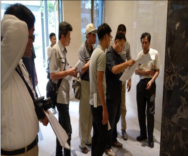
新北市政府工務局辦理 A6 東區申請 使用執照現場會勘