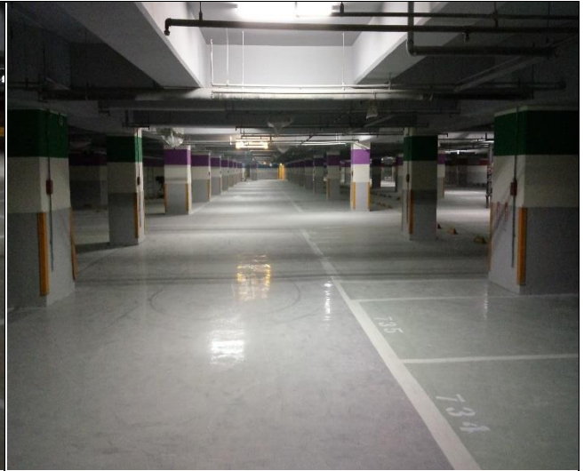
臺億公司辦理 A6 區裝修復原施工督導 | 1060914