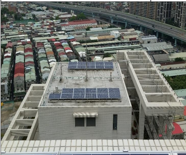
臺億公司辦理防側雷擊避雷系統勘查 1060901