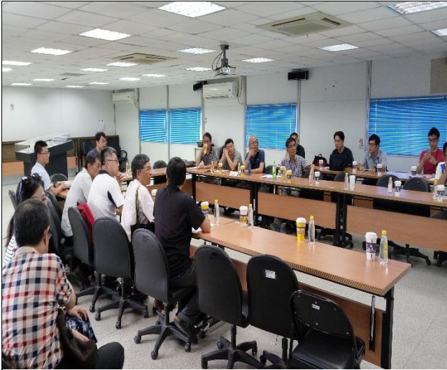
新北市政府工務局辦理 A6 東區申請 使用執照會勘簡報