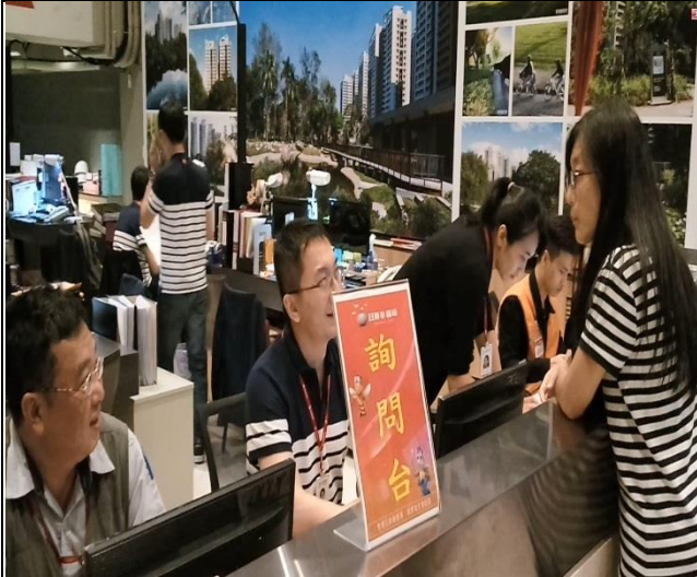
臺億公司辦理交屋驗屋督導