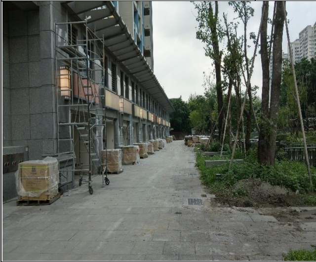
臺億公司辦理 A6 區裝修復原施工督導 | 1060914