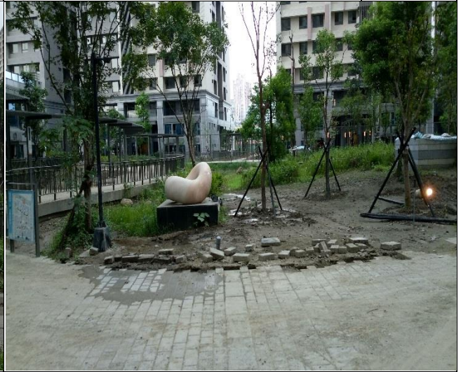
臺億公司辦理 A6 區裝修復原施工督導 | 1060914