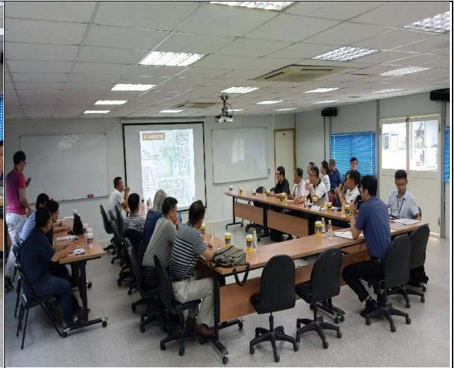
新北市政府工務局辦理 A6 東區申請 使用執照會勘簡報