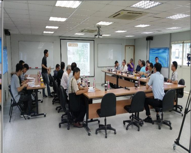
新北市政府工務局辦理 A6 西區申請 使用執照會勘簡報