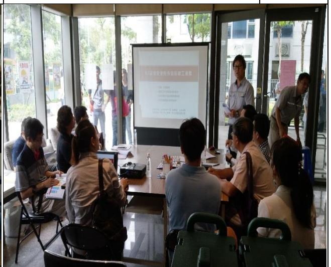
新北市政府工務局辦理 A2 區申請變更 使照併室內裝修會勘簡報 1060907