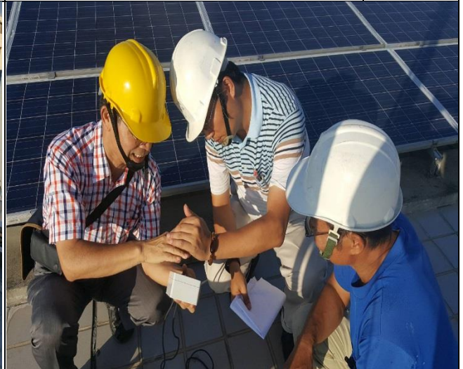
防側雷擊裝置完成第三方技師測試 1060913