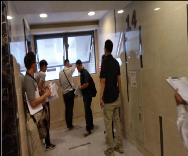
新北市政府工務局辦理 A6 西區申請 使用執照現場會勘