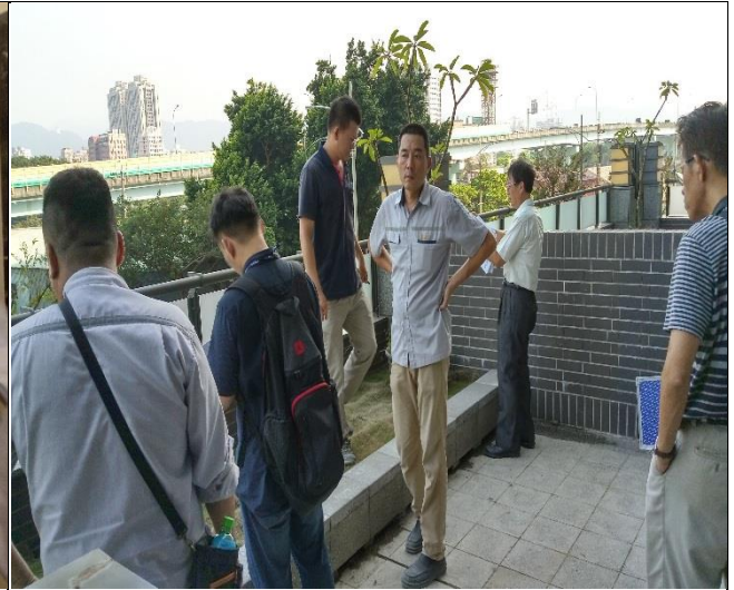
新北市政府工務局辦理 A6 西區申請 使用執照現場會勘