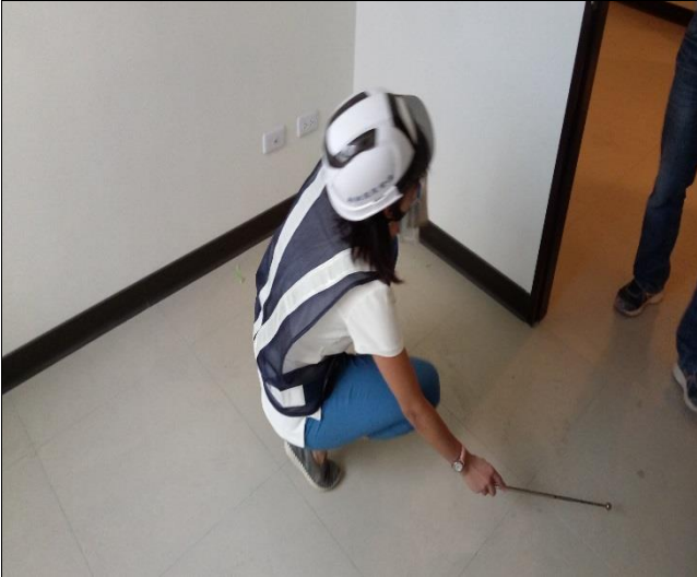
營建署辦理 A6 區裝修復原工程督導 1060907