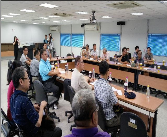
新北市政府工務局辦理 A6 西區申請 使用執照會勘簡報