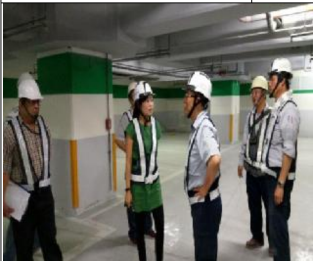
營建署 A3 區臨時工程督導