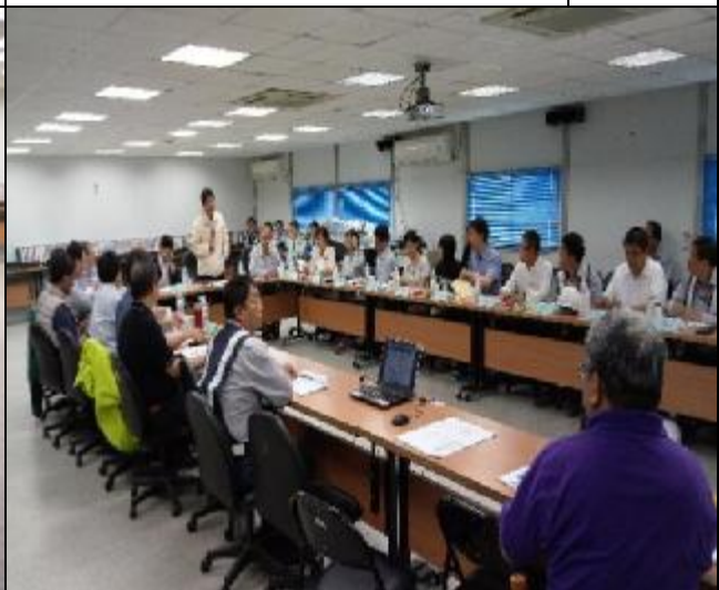
營建署辦理 A3 區完工確認會勘會議