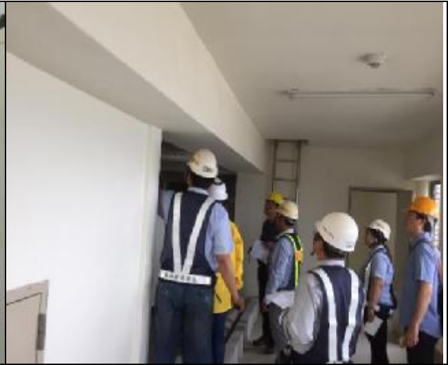
營建署辦理 A3 區完工確認會勘會議 1060516