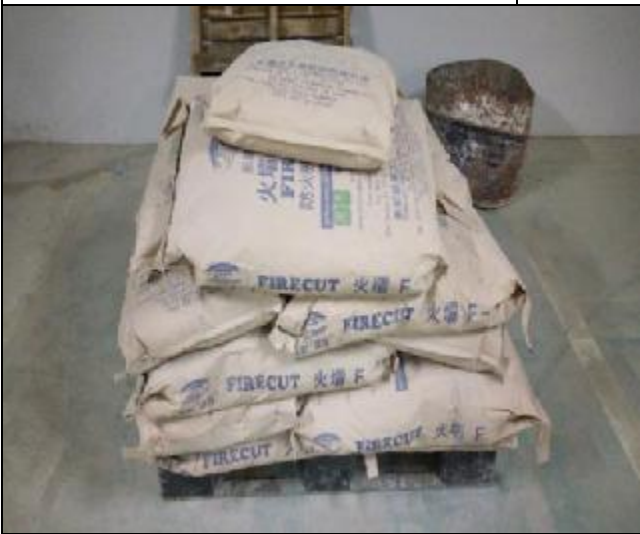
防火披覆材料督導