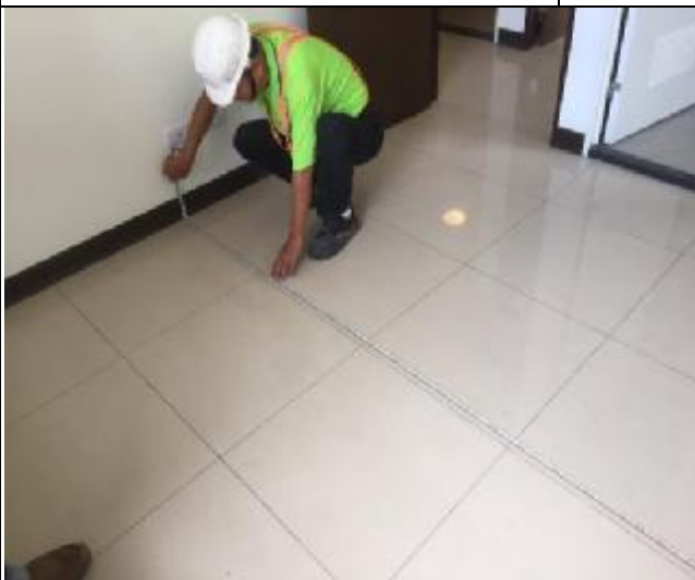
臺億公司工地督導-室內尺寸抽量測 1060520