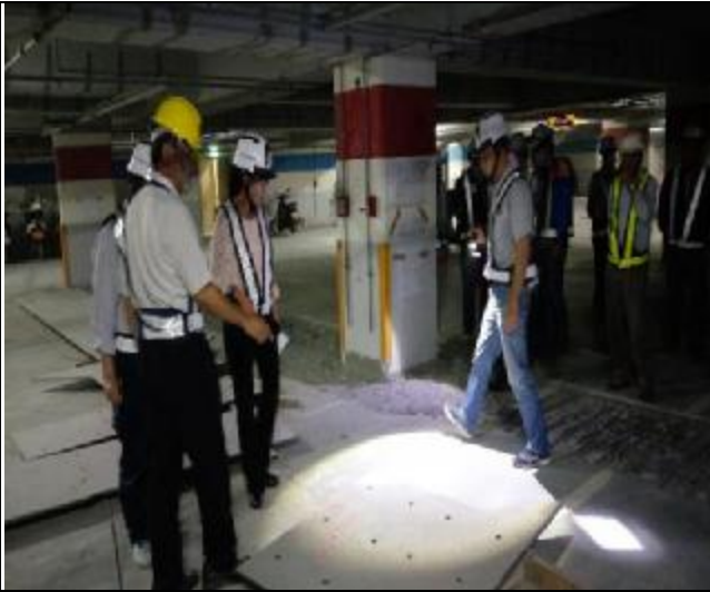
營建署辦理第九次工程查核現場會勘 1060517