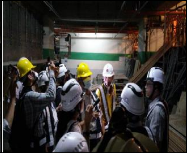
營建署辦理第九次工程查核現場會勘 1060517