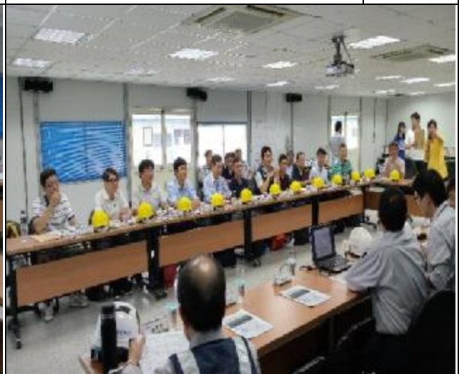
106 年 5 月 5 日臨時工程查核會議