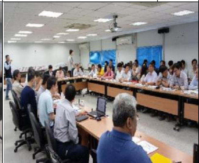
營建署辦理第九次工程查核會議 1060517