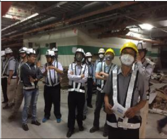
營建署辦理第九次工程查核現場會勘 1060517