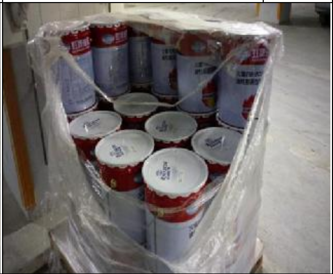
防火水泥材料督導