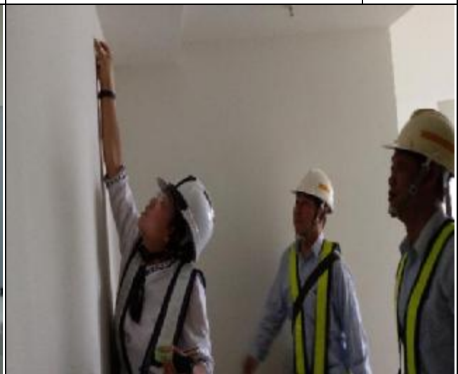
營建署 A3 區完工確認前置勘查與督導