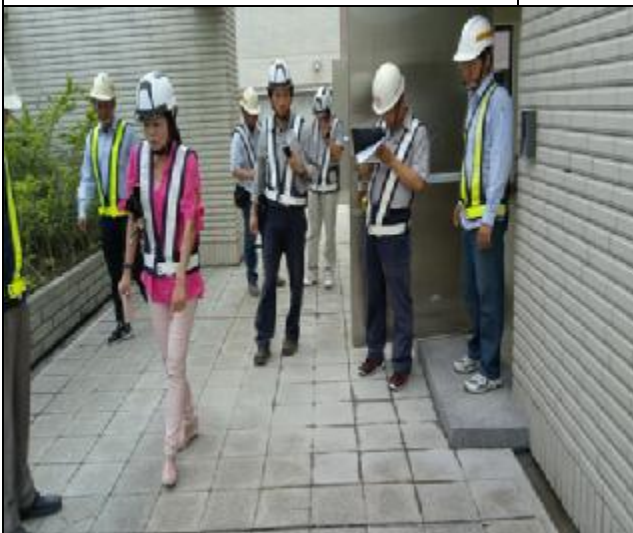
營建署 A3 區完工確認前置勘查與督導