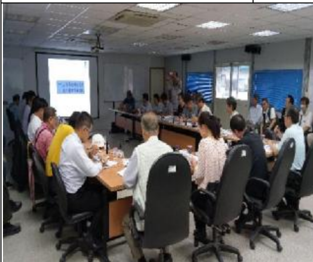
營建署辦理第九次工程查核會議 1060517