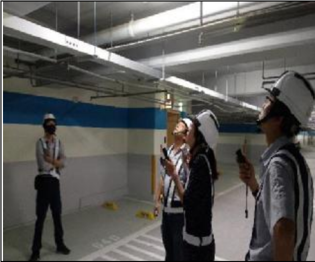
營建署 A3 區臨時工程督導