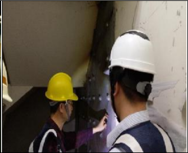
106年5月5日臨時工程查核現勘