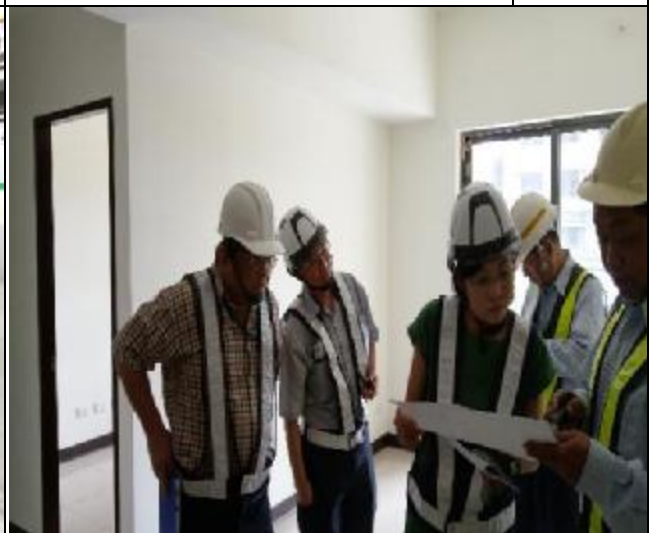
營建署 A3 區臨時工程督導