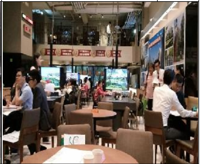
遞補選屋作業-臺億公司現場督導