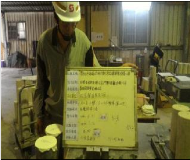
無收縮水泥實驗室抗壓試驗