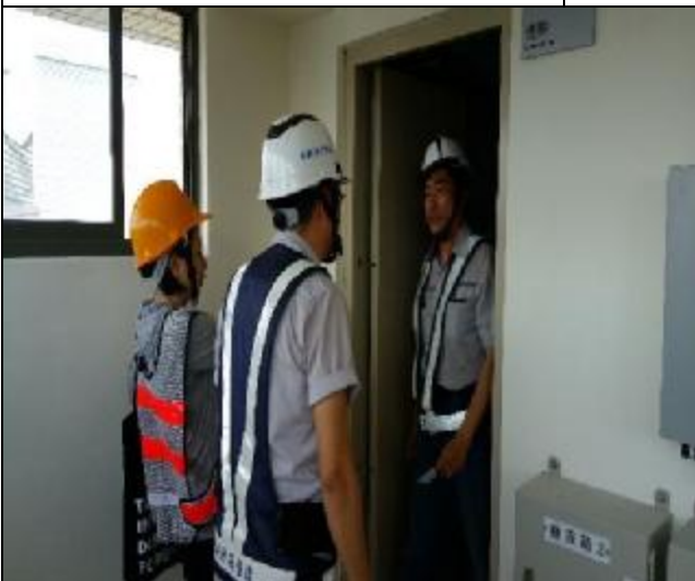
營建署 A3 區完工確認前置勘查與督導