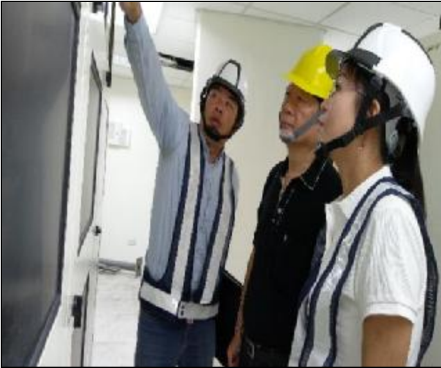
營建署辦理 A3 區完工確認會勘會議 1060516