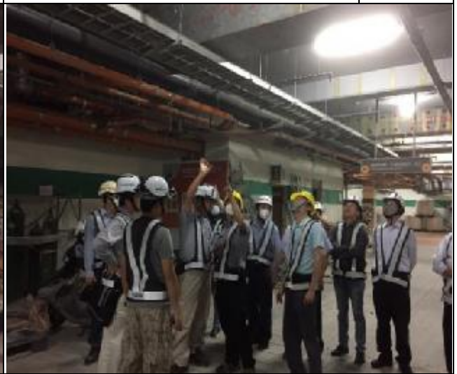
營建署辦理第九次工程查核現場會勘 1060517