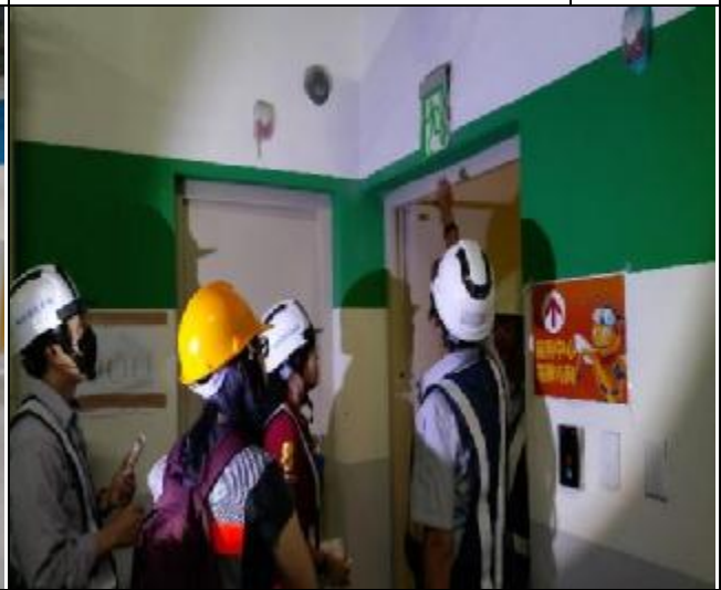
營建署 A3 區完工確認前置勘查與督導