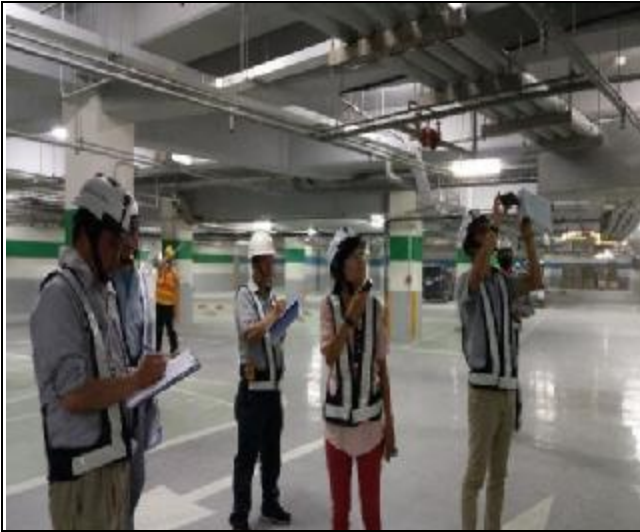
營建署完工確認缺失複查