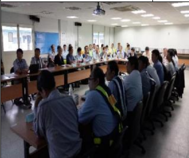
營建署辦理 A3 區完工確認會勘會議