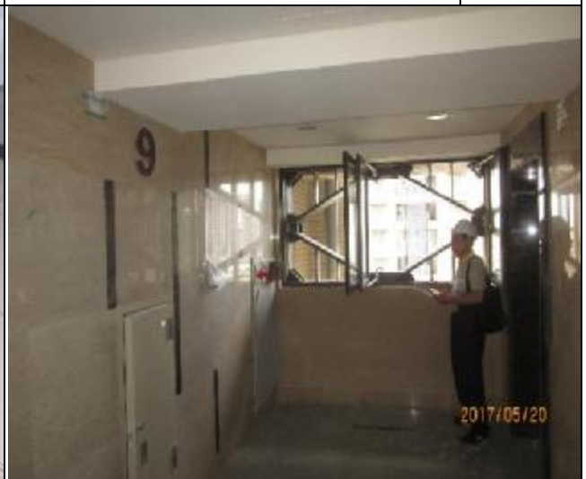
臺億公司工地督導 1060520