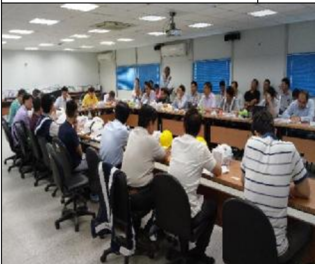
106 年 5 月 5 日臨時工程查核會議