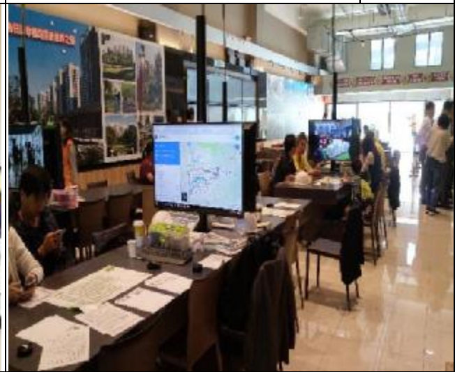
遞補選屋作業-臺億公司現場督導 1060517