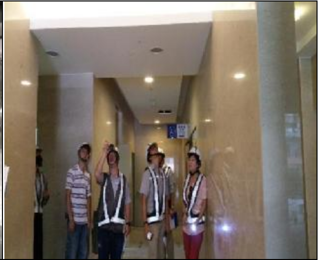
營建署完工確認缺失複查