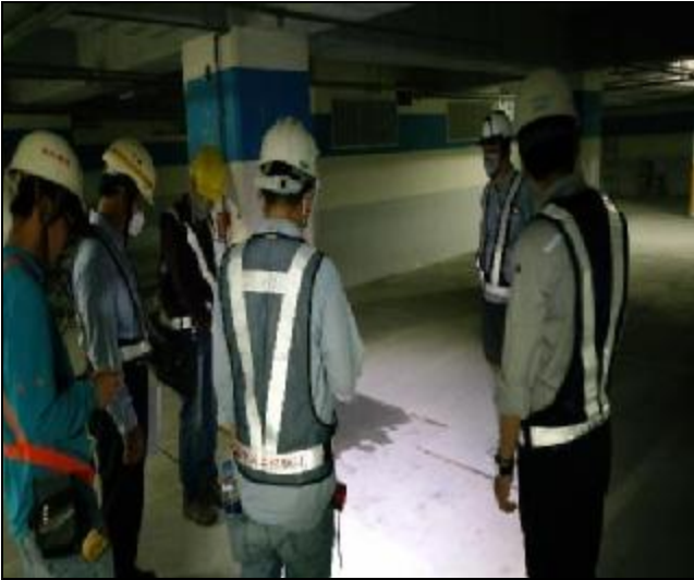
106年5月5日臨時工程查核現勘