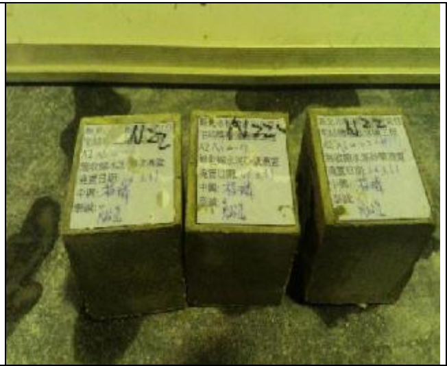
無收縮水泥實驗室抗壓試驗