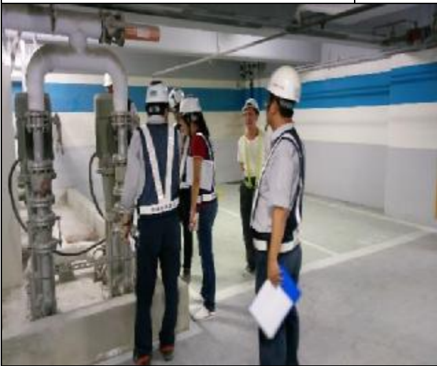
營建署 A3 區完工確認前置勘查與督導