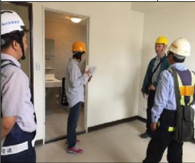
營建署辦理 A3 區完工確認會勘會議 1060516