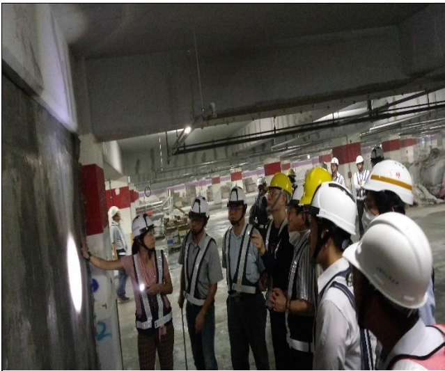
營建署辦理第十次結構補強工程查核會議現場會勘