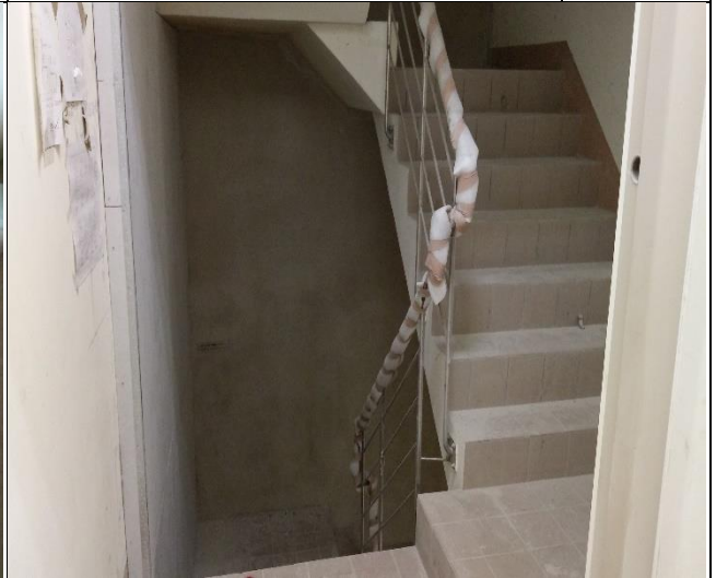
臺億公司辦理 A6 東區樓上層裝修工程 督導 1060613