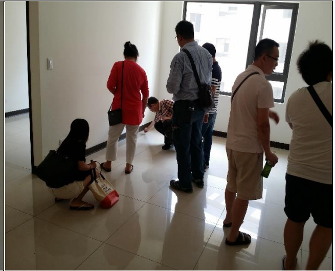
A3 區辦理驗交屋現場狀況