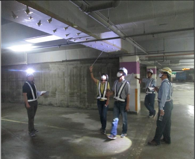
營建署 A6 東區 B2F~B3F 結構補強工程督導