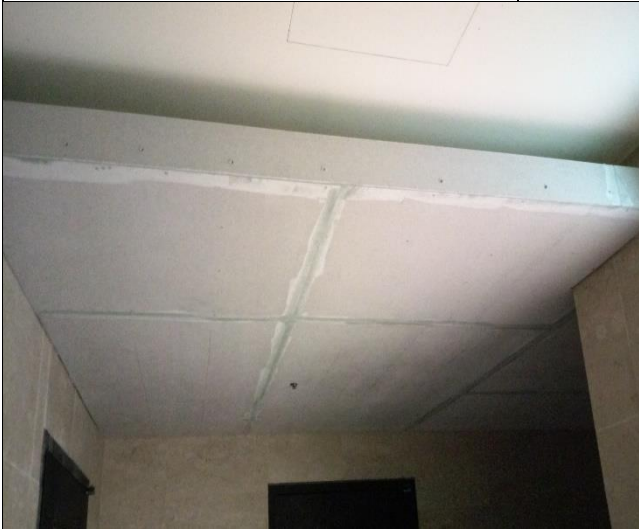
臺億公司辦理 A6 東區樓上層裝修工程 督導 1060613