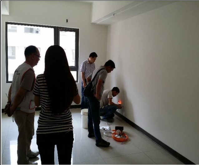
A3 區辦理驗交屋現場狀況