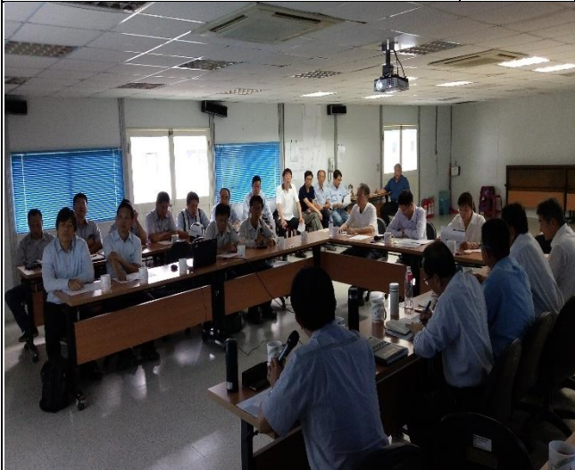
營建署辦理第九次臨時工程查核