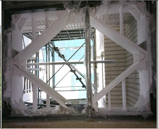
臺億公司辦理 A6 東區樓上層裝修工程 督導 1060613