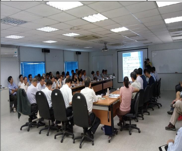
營建署辦理第十次結構補強工程查核會議