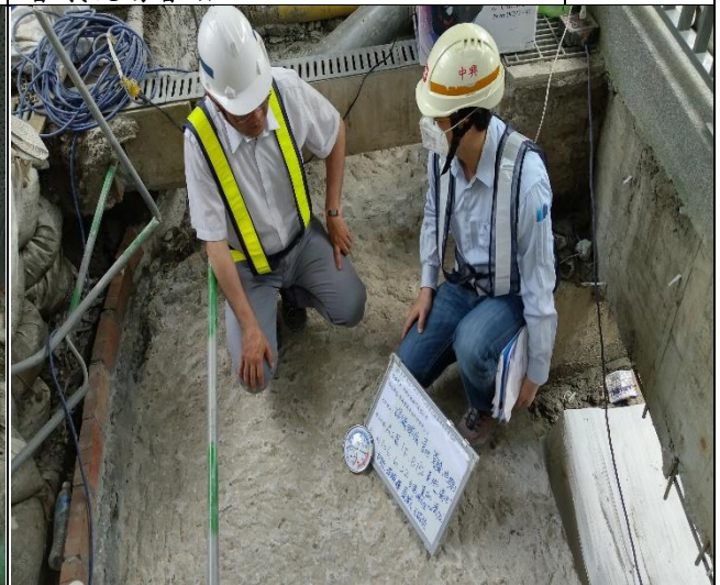
臺億公司於A2區碳纖素地乾濕度檢測督導