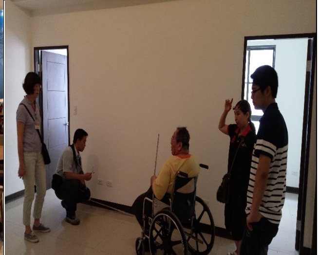
臺億公司於 A3 區辦理驗交屋現場狀況督導