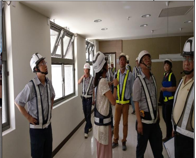
營建署 A3 區勘查與督導