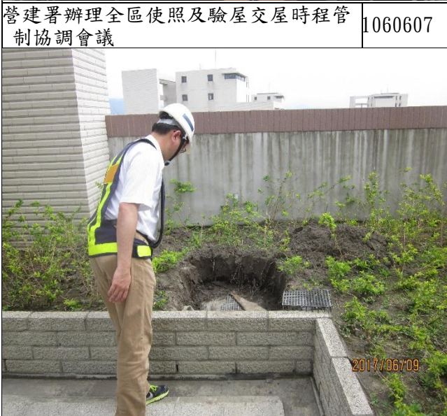
臺億公司辦理 A3 區完工確認 RF 排水管缺失施工督導