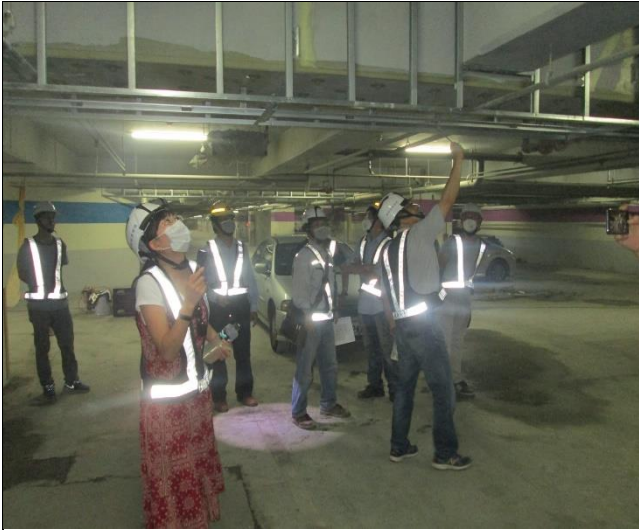
營建署 A6 西區 B3F 結構補強工程督導 1060612