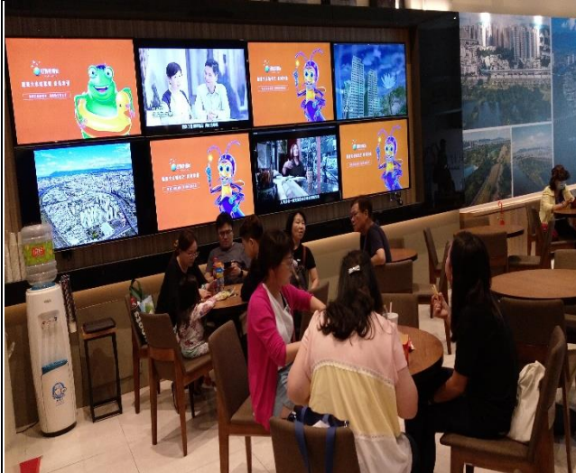
臺億公司於 A3 區辦理驗交屋現場狀況督導