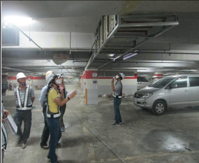
營建署 A6 東區 B2F~B3F 結構補強工程督導