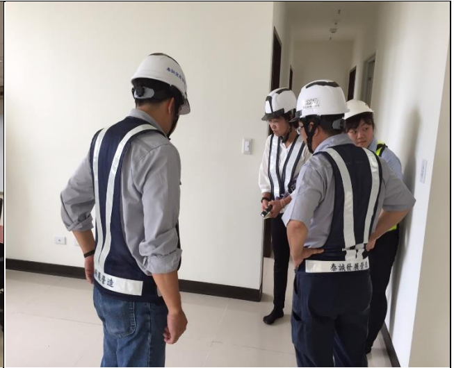
營建署 A3 區完工確認缺失改善督導