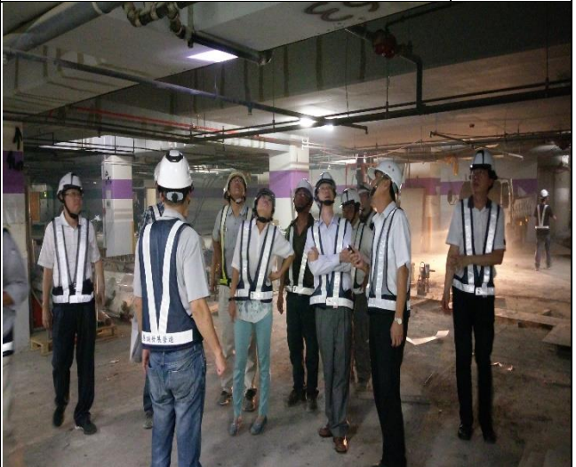
營建署第九次臨時工程查核