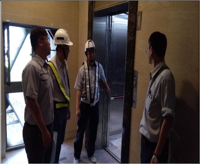
臺億公司於 A3 區辦理完工確認缺失改善督導