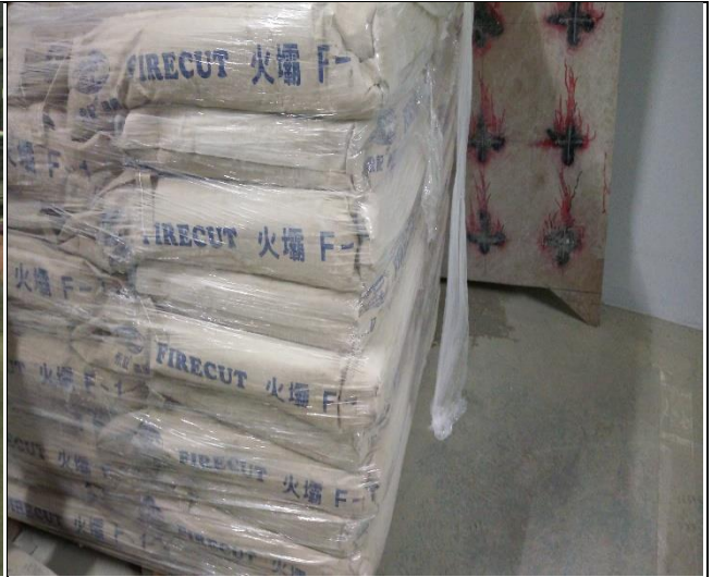
A6 西區 B2F 防火填塞材料抽查 1060612