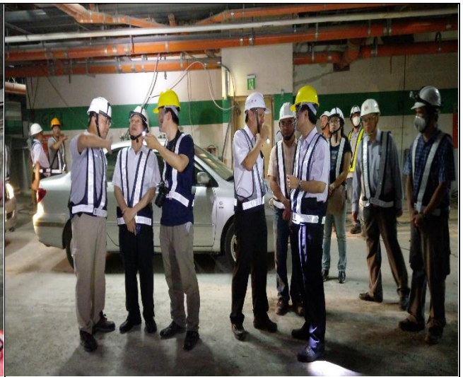
營建署辦理第十次結構補強工程查核會議現場會勘