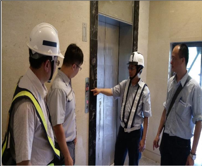
臺億公司於 A3 區辦理完工確認缺失改善督導