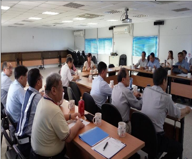
營建署辦理全區使照及驗屋交屋時程管制協調會議