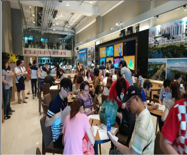
A3區辦理驗交屋現場狀況