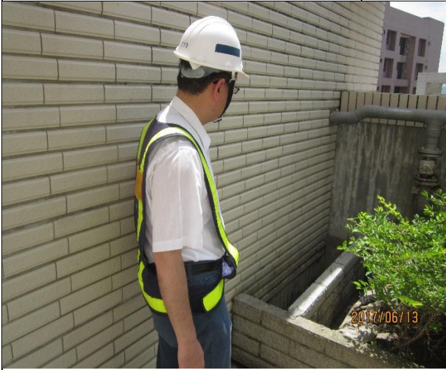
臺億公司辦理 A3 區完工確認 RF 排水 管缺失複查 1060613