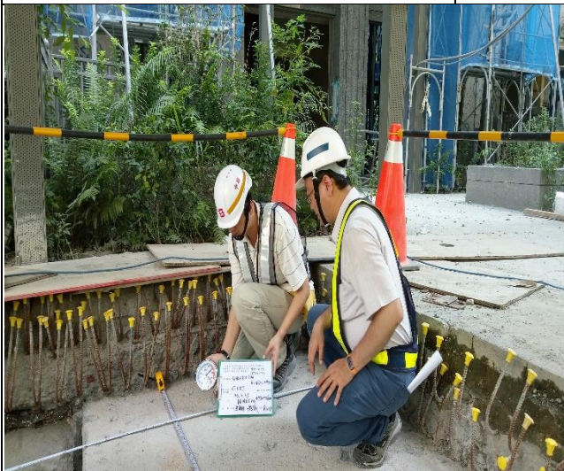
臺億公司於 A6 區碳纖素地乾濕度檢測督導