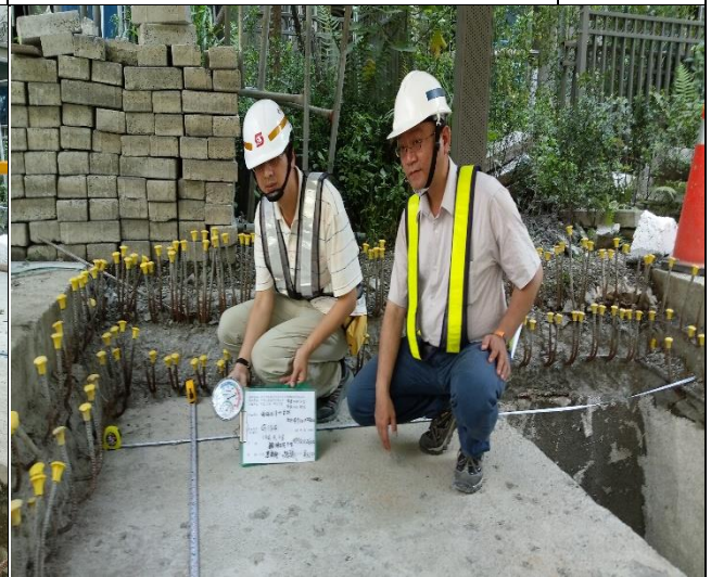
臺億公司於 A6 區碳纖素地乾濕度檢測督導