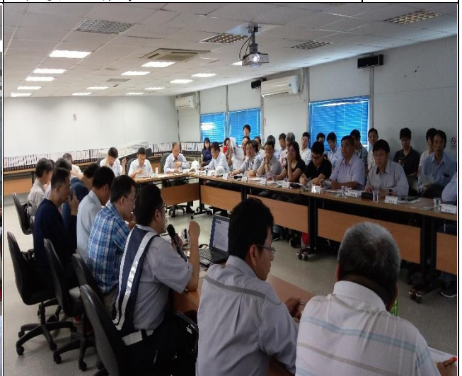
營建署辦理第十次結構補強工程查核會議