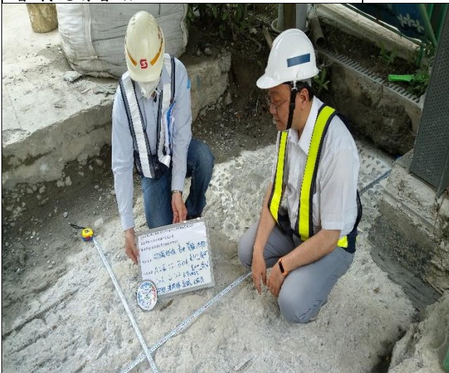
臺億公司於A2區碳纖素地乾濕度檢測督導