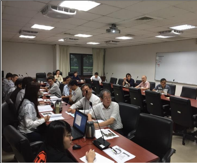
營建署辦理行政工作協調會議