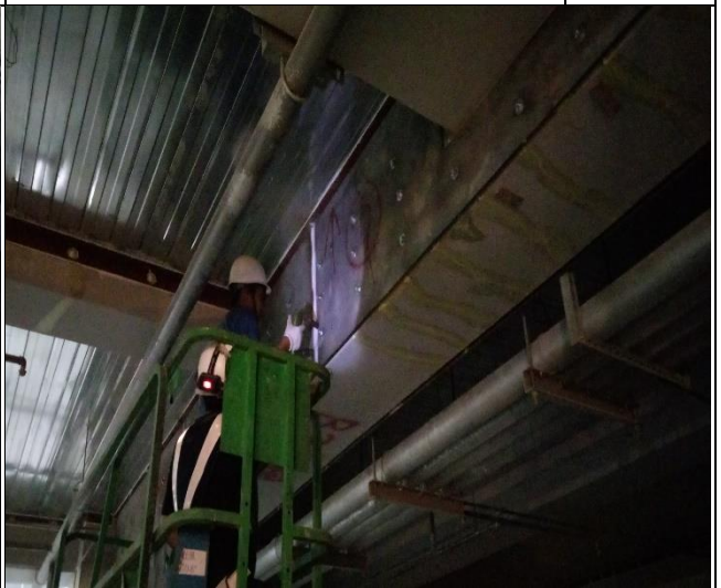
臺億公司於 A2 區 B1F 結構補強鋼板銲道檢驗督導