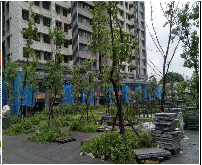
A6 區結構補強施作現況督導