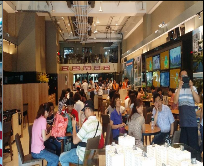
A3區辦理驗交屋現場狀況