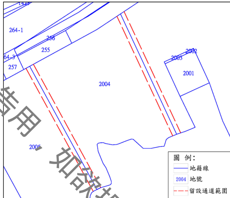
圖 1：指定留設南北向 8 公尺人行步道示意圖

本更新基地地號東西兩側應自土地境界線各留設 4 公尺通道，與鄰地形塑南北向 8 公尺人行步道，連通洲平路與歷史水景公園(詳圖 1)。倘鄰地與古堡段 2004 地號併同開發時，仍應遵循本原則留設南北向 8 公尺人行步道，惟其位置得依建築規劃內容適當微調之。