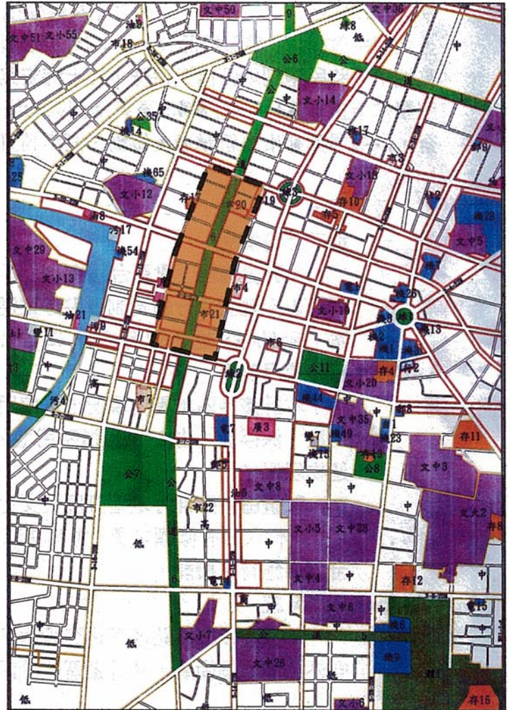
計畫範圍示意圖 - - - - 計畫範圍線