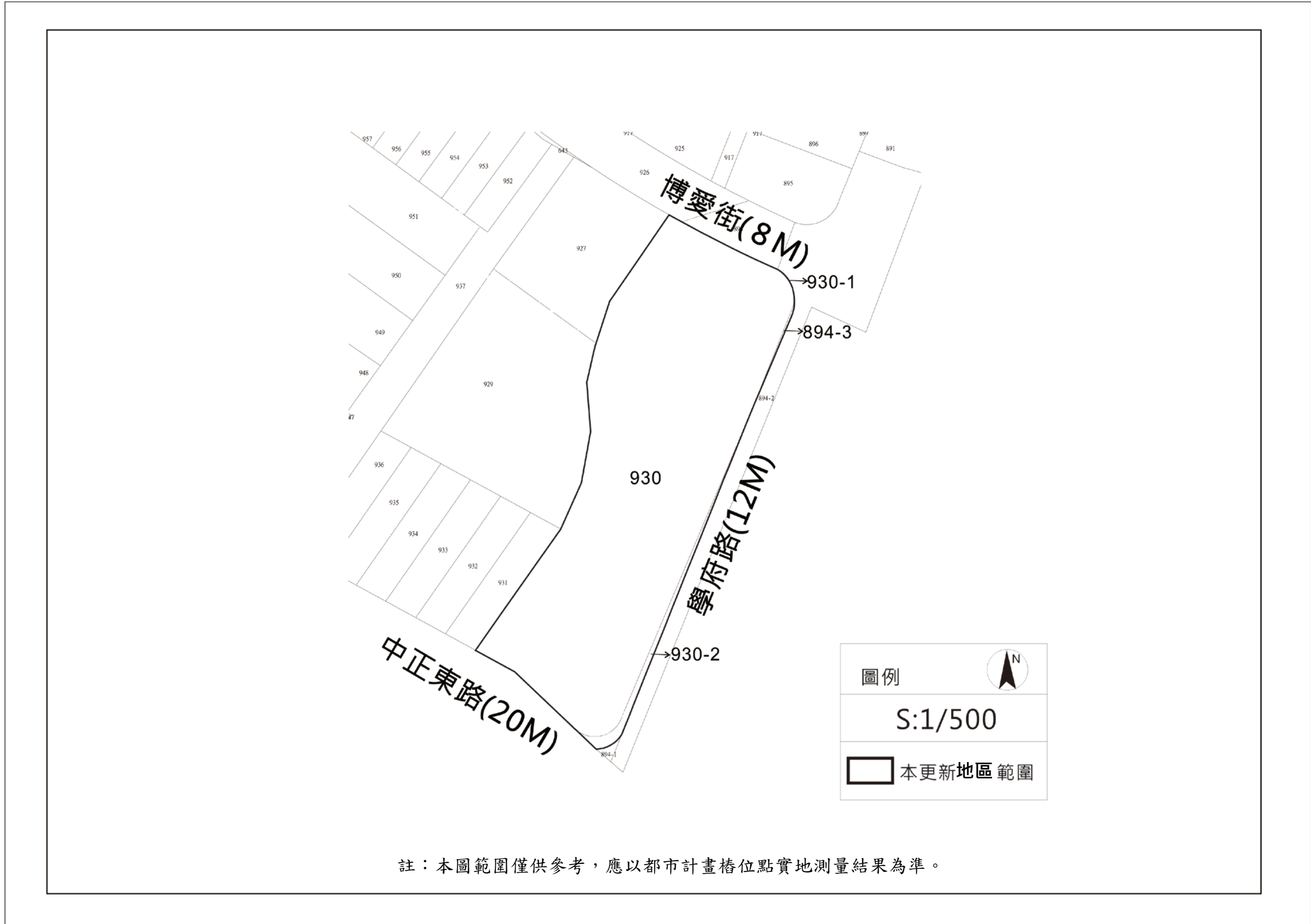
附圖 2、劃定新北市淡水區學府段 930 地號等 4 筆(原 1 筆)土地都市更新地區地籍示意圖