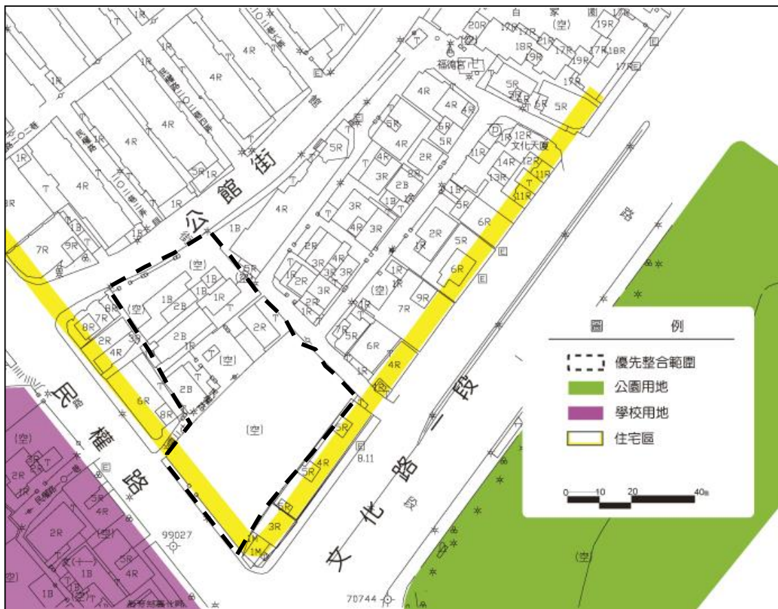
圖 2-2 基礎基地現況範圍示意圖