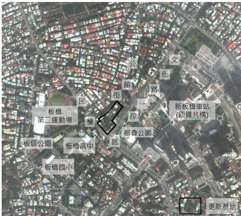
圖 2-1 基地位置示意圖

更新基地面對板橋區萬坪公園，北臨公館街，西側為民權路，南側為文化路一段，鄰近板橋四鐵共構車站（台鐵、高鐵、捷運板南線、捷運環狀線）及公車總站，可快速進出新北市其他行政區及台北市，為新北市交通樞紐及轉運中心，交通區位優越（詳圖 2-1 所示）。