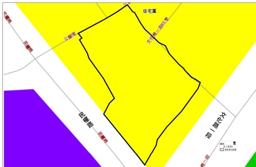
圖 3-1 基礎基地土地使用分區示意圖