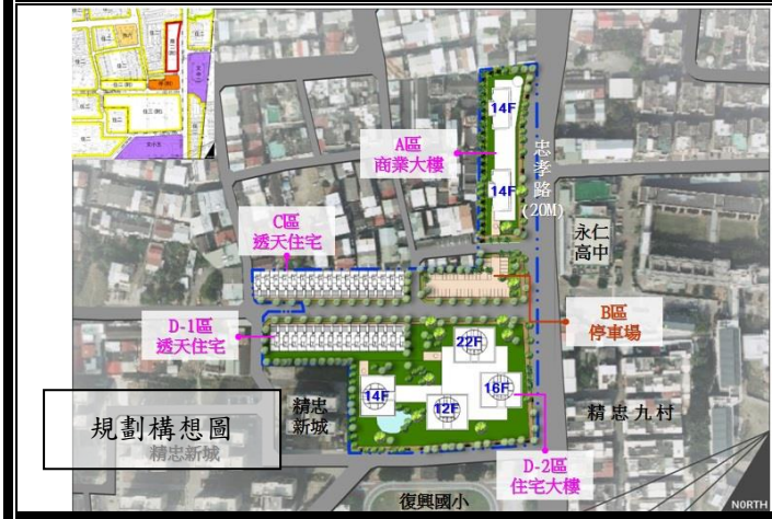
規劃構想圖 精志新城