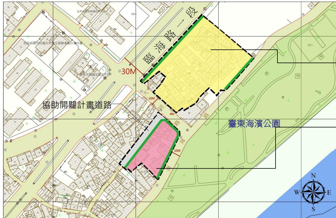
圖例 [ ] 規劃範圍 住宅使用、地面層沿街商業使用 保留土地管理機關決定用途 退縮4公尺留設人行道