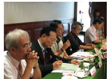
都市地區建築風貌整建維護專家座談會一現況照