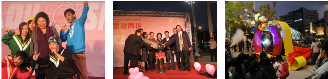
挽面創意頒獎暨婚紗大街裝置藝術啟用儀式 - 愛戀活動

為配合裝置藝術推動及挽面成果展示，高雄市政府都發局特別聯合婚紗業者及在地商圈共同舉辦「藏在城市裡的創藝-美麗島戀愛 FOREVER」啟用活動，並由市長、婚紗業者、南華市場管委會等 250 餘人共同為高雄婚紗產業與城市空間藝術發展見證加熱，宣揚市民參與城市美學改造運動，以展現高雄新城市風貌與共創產業新商機。