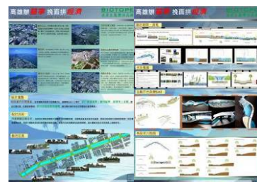
競圖評選、頒獎情況