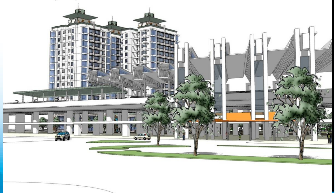
➤ 基地量體與火車站站體