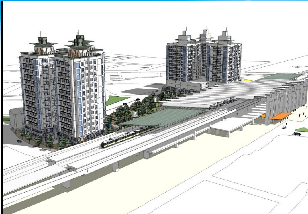
➤ 基地量體與火車站站體