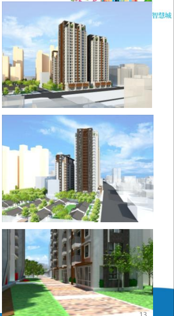
103年度都市更新投資說明會