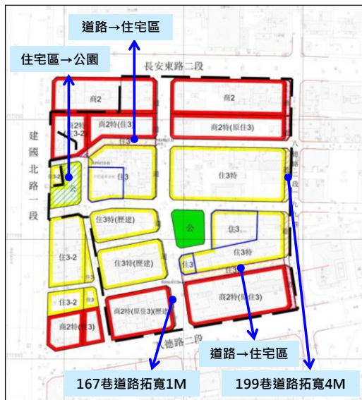
103年度都市更新投資說明會

藉由都市更新與交通整體規劃，促進土地開發效益，增加主要道路寬度及公園面積，改善當地公共設施環境與交通狀況。