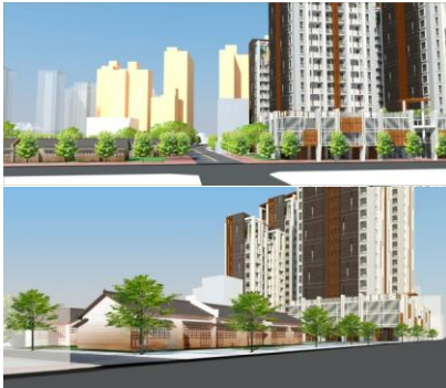
鄰八德路模擬示意圖