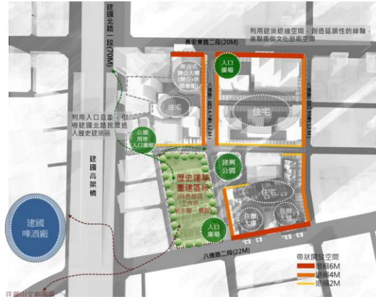
103年度都市更新投資說明會