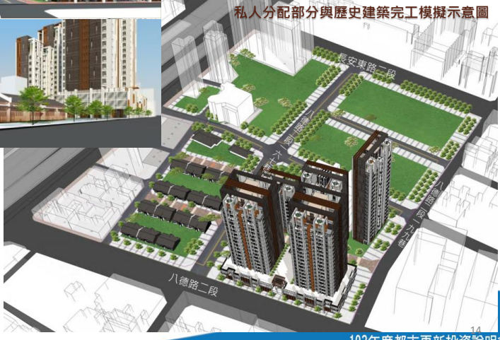
103年度都市更新投資說明會