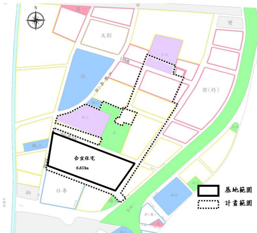
第二區土地標售區域位置圖