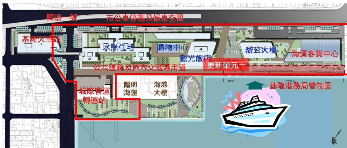
圖一 基隆火車站暨西二西三碼頭平面範圍圖