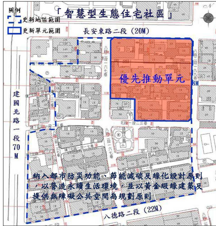
圖三 中山女中南側地區平面範圍圖