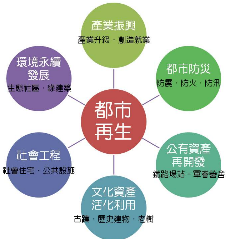
圖 3 整合型都市更新目標示意圖

災之區域再發展之整體目標，擬整合防災型都更計畫擬訂、公共設施用地之檢討及解編作業、中產及弱勢住宅政策，加上產業振興、環境永續發展、社會工程闢建、文化資產活化利用、公有資產再開發等都市更新整體計畫先期檢討評估後，就非必要的公共設施用地或閒置或低度利用的大面積公私有土地，檢討調整其土地使用分區，推動指標型都市更新計畫，由政府公辦都更，作為地區再發展的觸媒；另針對應予重建、整建、維護或結構補強之建築區塊，提供指導方針及啟動自主更新輔導機制。